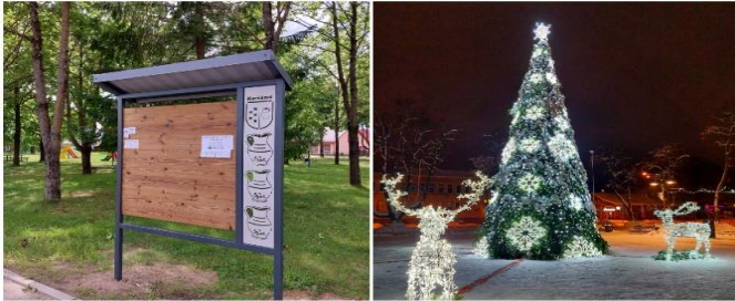
Pasodintos hortenzijos, atnaujintos miesto skelbimų lentos, miestas papuoštas šventėms