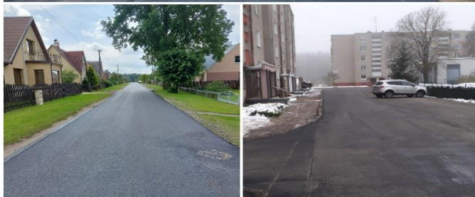
Paprastasis asfalto remontas Daugėlių g., Sodžiaus g. atkarpose. Išasfaltuotas Daugėlių 80 daugiabučio kiemas