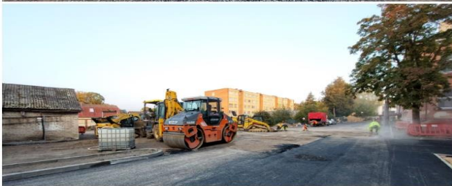
Išsalfuotas J. Basanavičiaus 3,5,7 kiemas