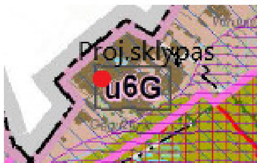
Kraštovaizdžio apsaugos ir vystymo

a- tausojantis; 6- intensyvus agrarinis; G-moreninis bei fliuvioglacialinis gūbrys/kalvyngubrys. Todėl patvirtinto bendrojo plano sprendiniai įtakos neturi nepagrindinių rodiklių keitimui.