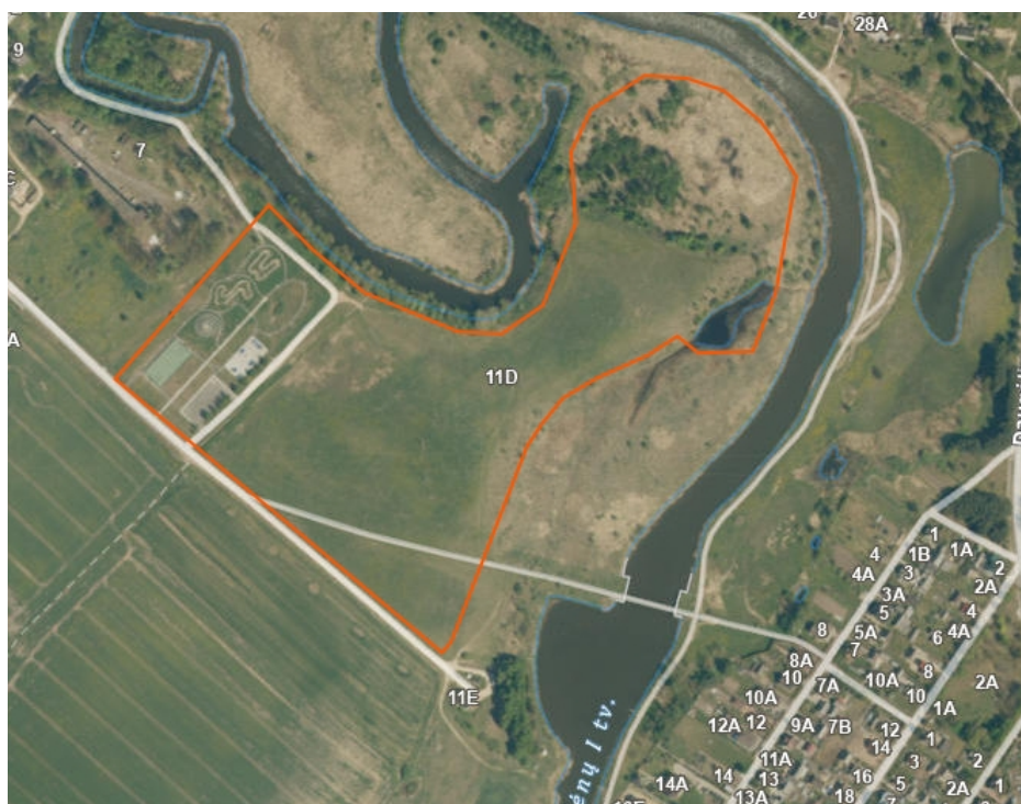
1 pav. Planuojamos teritorijos schema ( www.geoportal.lt ).