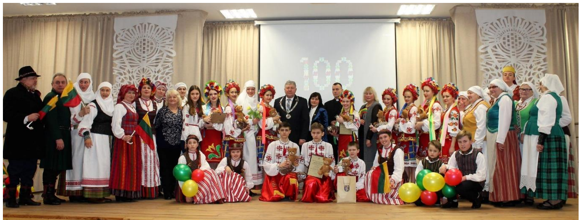
1 pav. Lietuvos valstybės atkūrimo 100 – mečio šventės akimirka Kužiuose

Kužių seniūnijos sportininkai dalyvavo žydų bendruomenės organizuojamajame Taico Liovos sporto turnyre Šiaulių mieste ir atstovavo Šiaulių rajoną, kuriame stalo teniso rungtyje buvo laimėta 1-oji vieta. Gegužės mėnesį ta pati komanda atstovavo Kužių seniūniją Šiaulių rajono sporto žaidynėse.