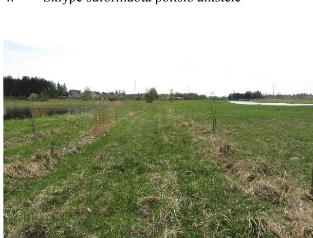
6. Suformuota klevų alėja (grupė)