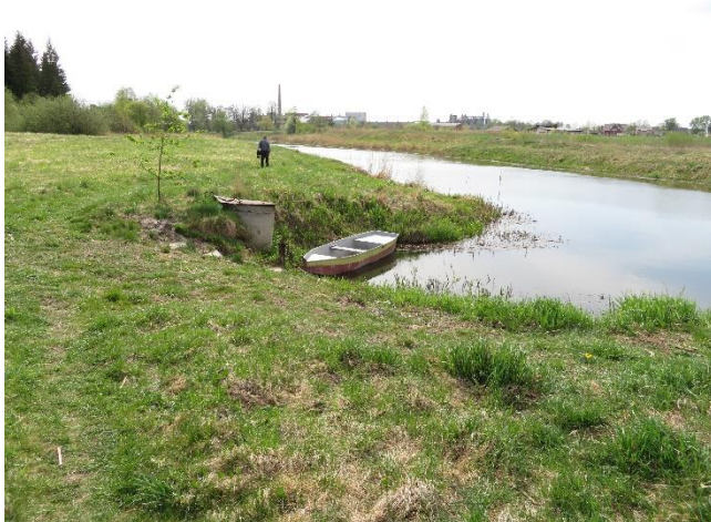
11. Esama prieplauka