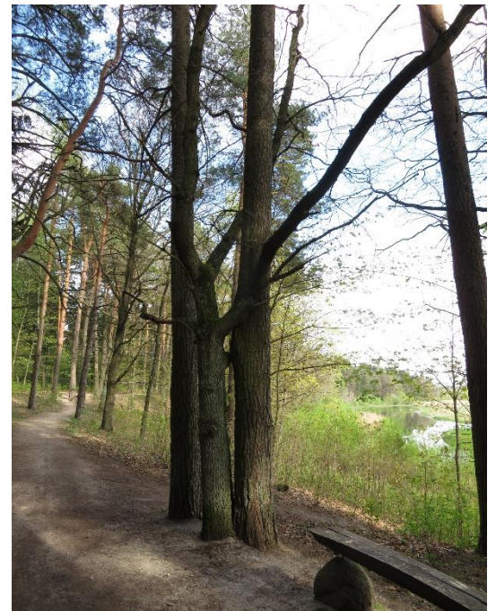
18. Greta projektuojamo sklypo esančio Rekreaciniame miške esanti poilsio aikštelė ir vizualinis ryšys su projektuojama teritorija