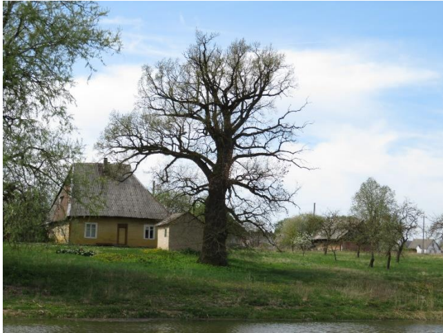
13. Vizualinis ryšys su kitame Ventos krante esančia gamtos paveldo vertybe – ąžuolu.