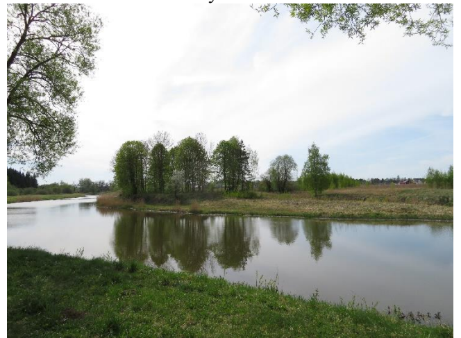
10. Vizualinis ryšys su pusiasaliu.