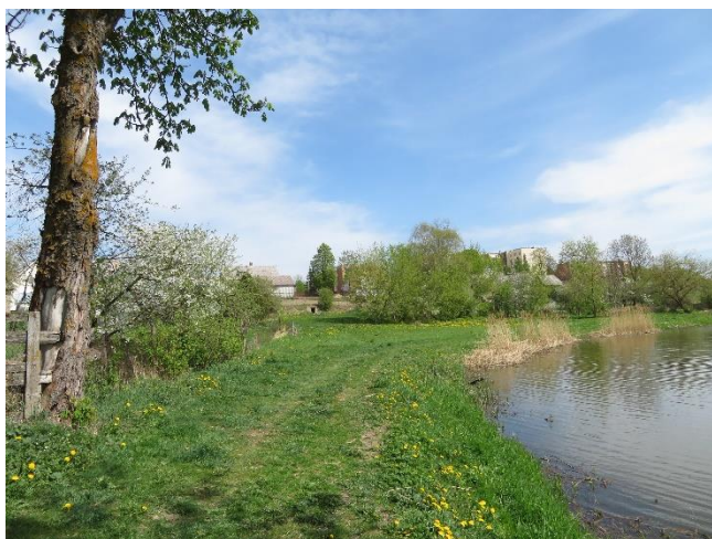
1. Savaiminis pėsčiųjų takas greta Ventos upės