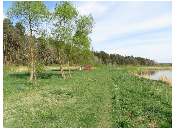
16. Poilsio aikštelė