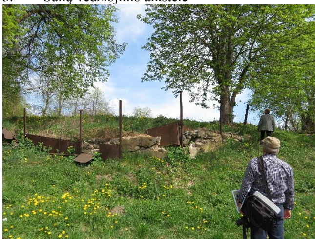
5. Estetiškai nepatrauki ir nesaugi sklypo riba.