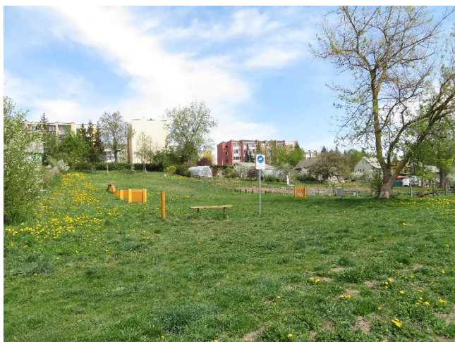
3. Šunų vedžiojimo aikštelė