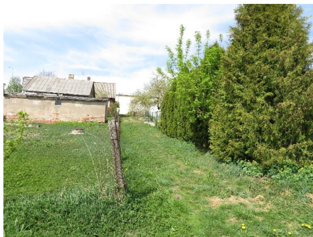
2. Projektuojamos teritorijos jungtis su Naująja gatve