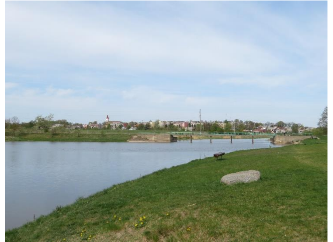
8. Vizualinis ryšys su pagrindine Kuršėnų dominante – bažnyčia.