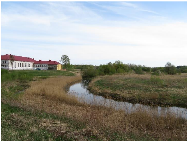
17. Projektuojamos teritorijos gretimybė Šiaulių r. Kuršėnų sporto mokykla