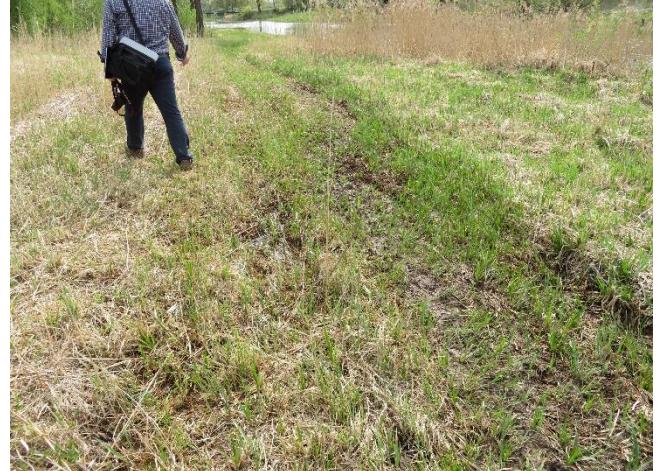
12. Užpelėjusi (apsemiama) teritorija