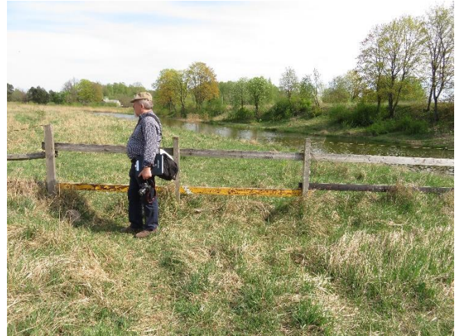
14. Ganyklos tvora apribojanti praėjimą pakrante