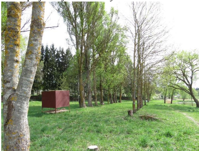
9. Paprastųjų uosių ir tuopų alėja