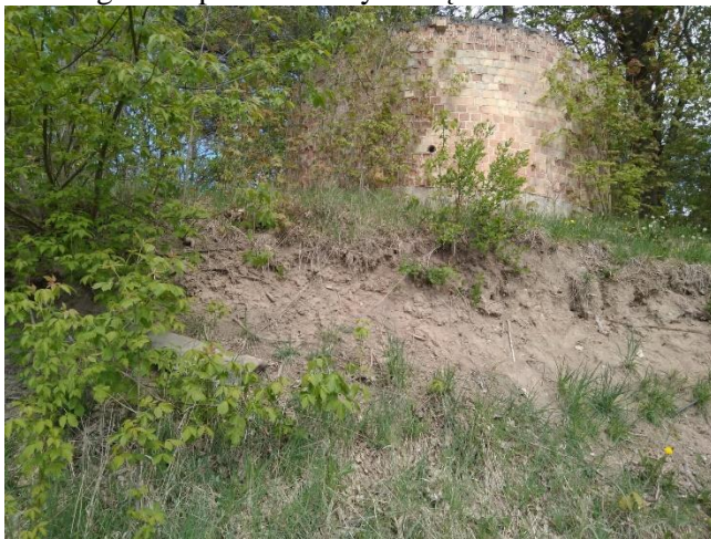
15. Greta projektuojamos teritorijos esanti vandens siurblinė