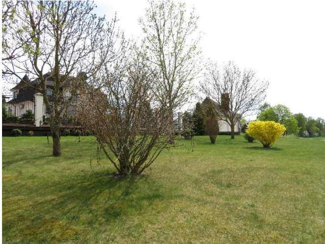
7. Gretimo sklypo savininkų iniciatyva suformuoti projektuojamos teritorijos želdiniai